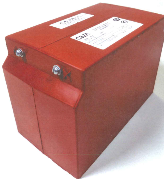
Рисунок 2 – Общий вид трансформаторов напряжения ЗНОЛ-СВЭЛ-0,66. Вид со стороны первичной обмотки