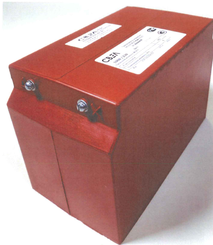
Рисунок 4 – Общий вид трансформаторов напряжения НОЛ-СВЭЛ-0,66. Вид со стороны первичной обмотки